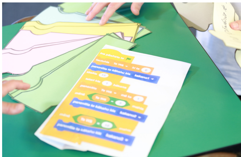
Kua Rāhuitia Katoatia ngā Tika. Kia Takatū ā-Matihiko | Digital Readiness

I tēnei ngohe ka waihangatia e ngā ākonga he papatono mā te whakamahi i ngā taurangi me ngā tauākī 'mēnā ... kē atu ...' Ka whakamahia te taupānga tuhiwaehere ā-paraka o Scratch. Ka whakaatu ko te tinaku o te kākano. Kua tuku tēnei ngohe mai i Code Club 4 Teachers, he wāhanga anō o Kia Takatū ā-Matihiko.